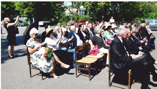
A megemlékezésre az ország minden területéről jöttek