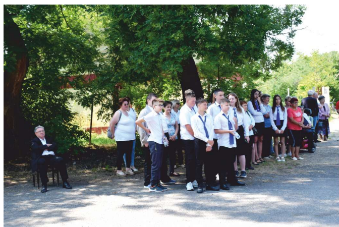
A megemlékező műsort a Református Általános Iskola tanulói adták