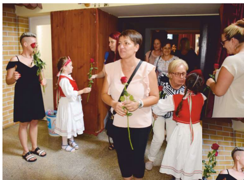
Virággal köszöntik a pedagógusokat